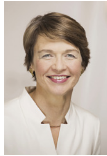
Schirmherrin Elke Büdenbender:

Die Initiative Klischeefrei ist eine festgeschriebene Maßnahme zur Förderung der Gleichstellung der Geschlechter in der Agenda 2030, der Nachhaltigkeitsstrategie der Bundesregierung.