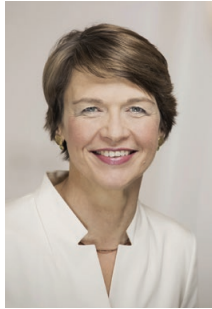
Schirmherrin Elke Büdenbender:

„Wir wollen Jugendliche ermuntern, gängige Rollenklischees kritisch zu hinterfragen.“